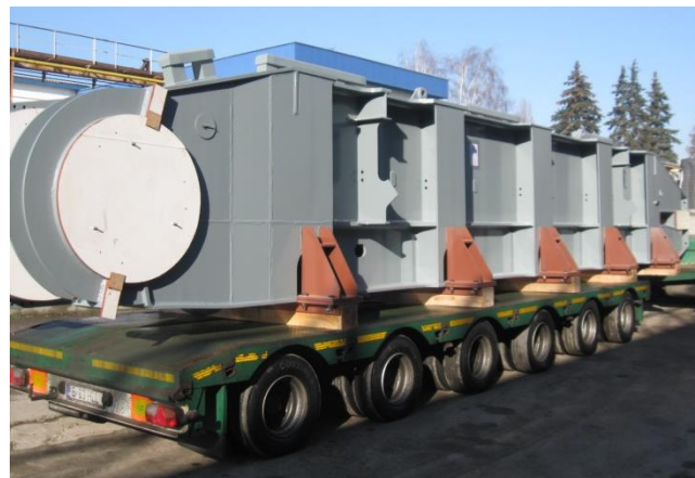
Детали дробилок, проект Esteril — Бразилия