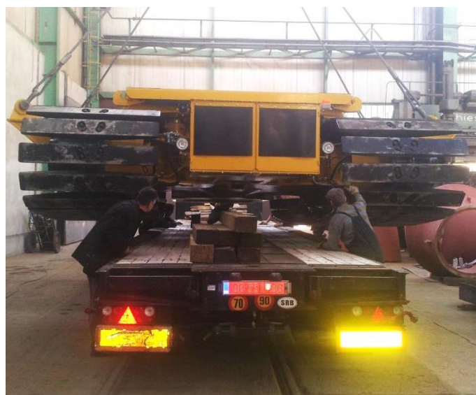
Гусеничная платформа T250 — Бразилия