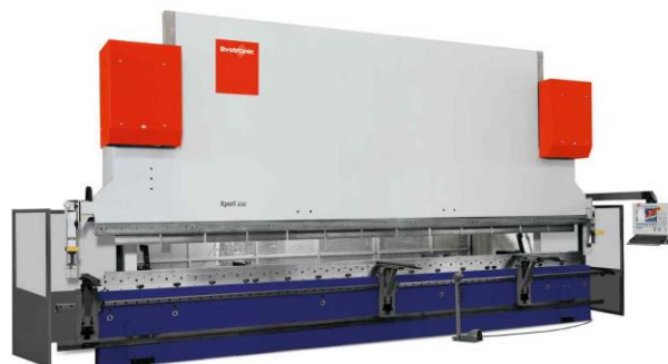
Последняя машина в нашем машинном парке: пресс для гибки Bystronic Xpert 800 (L=6200мм)