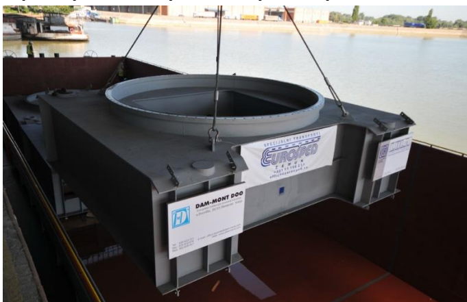
Нижнее строение на речной барже, проект Cöllolar-Турция