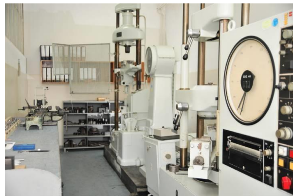
Лаборатория механических испытаний

Контроль качества в наших мастерских регулярно проводится, от входного контроля, через промежуточный контроль, до контроля готовой продукции. Любой продукт, который исходит от нашей компании, проверяется с помощью калиброванного оборудования и имеет сертификаты химического состава, механических свойств и отчеты о неразрушающем контроле.