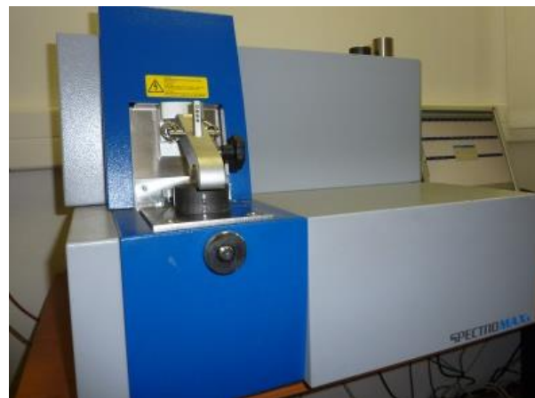
Квантометр SPECTROMAXX F