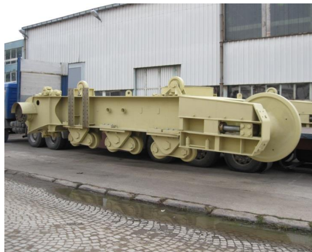
Детали отвалообразователя ARS 2000, г. Костолац - Сербия 7