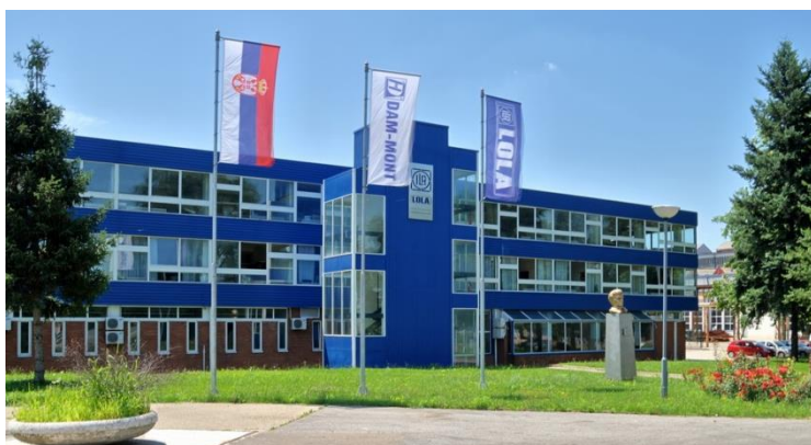
Местонахождение компании в Белграде и Двориште, Сербия

С 2007 года, Дам - Монт является собственником Лола Ливница — Пом, в Белграде. Завод состоит из двух основных подразделений, литейного и производства технологического оборудования и машин. Диапазон продукции и производственных мощностей значительно расширен путем приобретения производственных объектов Лола из Белграда.